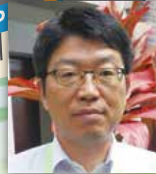
琉球大学 工学部 工学科 電気システム工学コース 教授 千住 智信