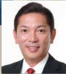
浦添市長 松本 哲治